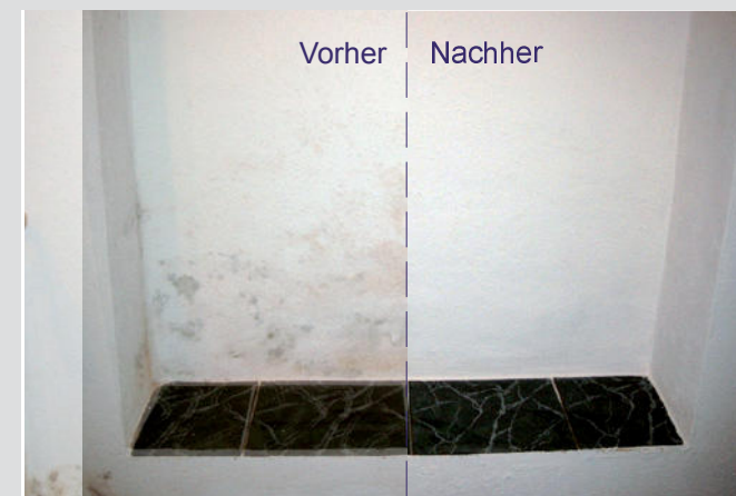
KefaRid beseitigt den Schimmel dauerhaft