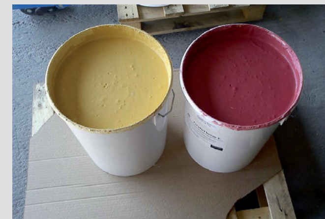
KefaRid kann abgetönt werden

Gesundheit & Hygiene. KefaRid schützt auf Jahre vor Feuchtigkeit und gewährleistet hygienisch einwandfreie Oberflächen. Davon profitieren unsere Gesundheit sowie eingelagerte Güter.