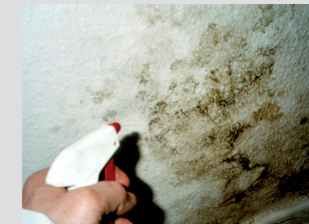
KefaWash wird auf befallene Flächen aufgesprüht

Eine runde Sache. KefaRid ist ein Fertigprodukt, das sich ähnlich wie Farbe auftragen lässt. – Denkbar einfach in der Anwendung, für eine dauerhaft geschützte Bausubstanz.