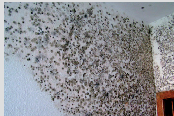
Schimmel hat in Wohnungen nichts zu suchen

Genial einfach – weil Physik immer wirkt