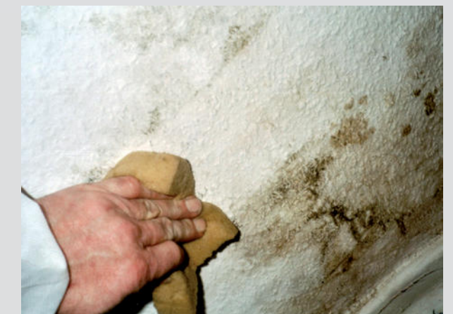
nach kurzer Einwirkzeit kann die Oberfläche gereinigt werden

KefaWash – Reiniger zur Vorbehandlung von bereits mit Schimmel, Algen und Bakterien befallenen Flächen. Hocheffektiv und umweltfreundlich durch Verzicht auf freie Chlor- und Natriumverbindungen.